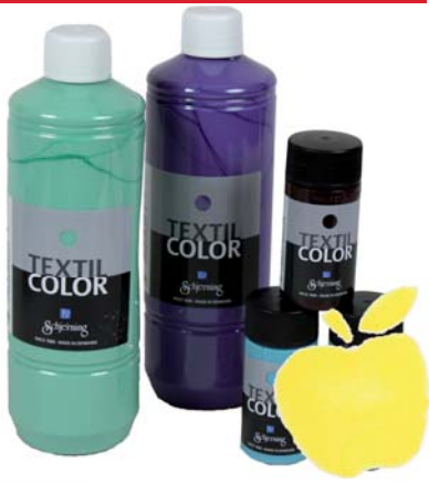
Valkoinen 1601 50 / 500 ml